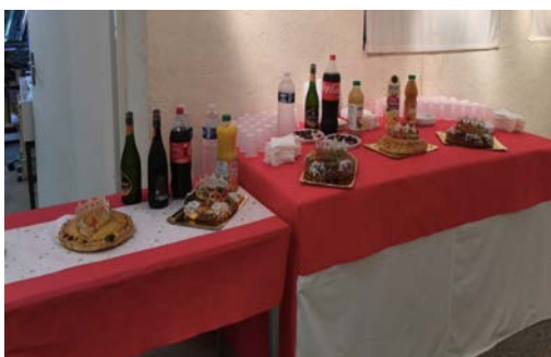
Convivialite.....et gourmandise..... avec la traditionnelle galette des rois