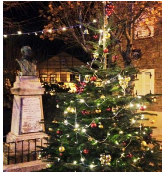
Notre beau sapin de Noël orne la place du village pour le bonheur des petits et grands !

In suddacaro a tradizioni stà, u rochju hé accesu davanti a ghjesgia in segnu di gioia. Stu focu t'hà u puteri d'aduniscia tutti i paesani da u più chjucu o più maio da prigà é scambià auguri. Par st'uccasioni ci hé un cunfocu cù fritreddi e vinu. Ma nanzi u lindumani si ricuperaia a brusta da buliàla à quidda di i nosci sclaminè in segnu di felicità