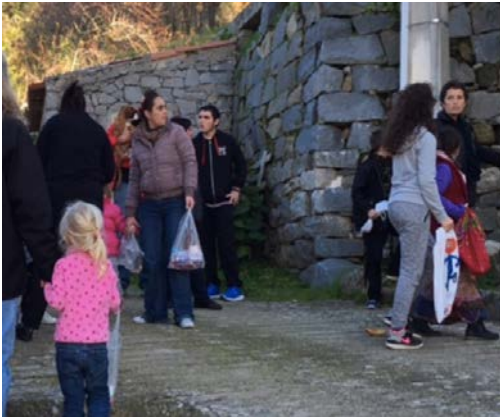
Sant'Andria Promenade agréable dans le village Les enfants ont fait une belle récolte de bonbons