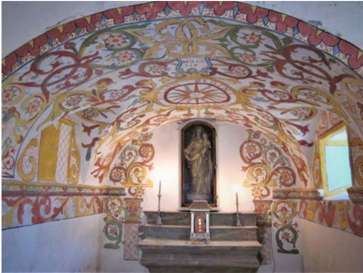
Eglise de Sant'Albertu di Calvesi : chapelle de la Vierge du Rosaire au décor floral (1759), après restauration