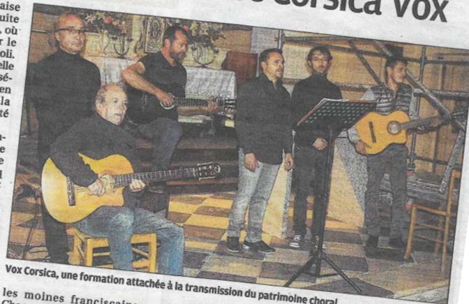
Vox Corsica, une formation attachée à la transmission du patrimoine chorale.

Durant un peu plus d'une heure, Vox Corsica a donné une prestation de qualité. Elle a alterné chants polyphoniques profanes - interprétant notamment des classiques du patrimoine chorale corse - et de magnifiques chants sacrés transmis par