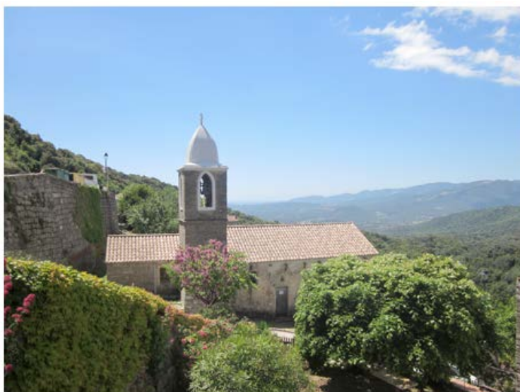
Eglise de Sant'Albertu di Calvesi, façade nord, état actuel

La paroisse de Calvesi appartenait à la pieve di Valle d'Istria , dans la seigneurie du même nom formée par les territoires des villages de Mocà, La Croce, Moriccio, Argiusta, Olivese, Sollacaro, Casalabriva, Petreto et Bicchisano. Selon Mgr Agostino Giustiniani, la pieve de Valle d'Istria comprenait encore au XVI siècle Casalabriva, Sollacaro, Olmeto et Calvesi. Le village ne comptait que 100 âmes en 1586, consécutivement aux razzias des corsaires turcs qui le touchèrent au moment des expéditions de Dragut entre 1545 et 1549, et à des exactions de la part des génois. Calvesi ne se développera donc que lentement au cours des XVIIe et XVIIIe siècles. En 1726 sa population était de 137 habitants, puis elle passait à 220 âmes en 1768. En 1831 la population communale de Calvesi était de 243 habitants et baissait à 209 habitants en 1836, pour atteindre son étiage en 1841 avec seulement 188 habitants.