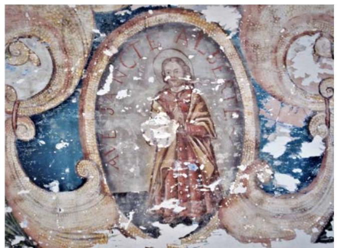
Eglise de Sant'Albertu di Calvesi : peinture à l'huile de l'antependium du maître autel représentant le saint en médaillon dans un décor de jardin (XVIIIe siècle).

L'église paroissiale de Calvesi fut placée sous le vocable de saint Albert le Grand au XVIIe siècle. Le sanctuaire fut agrandi grâce à la libéralité de Pietro Felice Casabianca qui fit don du terrain nécessaire à la construction de la nef vers 1750. Sa sépulture dans le chœur, date de 1790. Le clocher a été construit (ou reconstruit ?) en 1816, mais il ne sera achevé qu'en 1938 par un dôme ogival que l'on vient de rénover. La chapelle latérale sud est dédiée à Notre-Dame du Rosaire. Le décor pictural