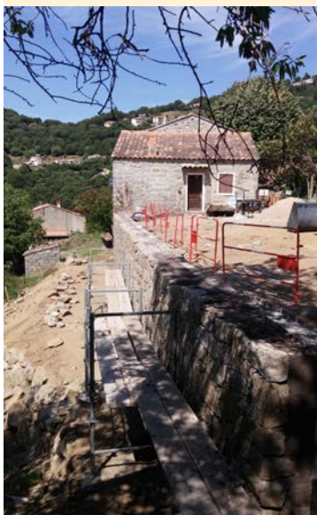
Mur de Calvese